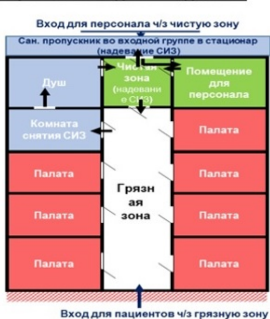
Схема модульного инфекционного стационара